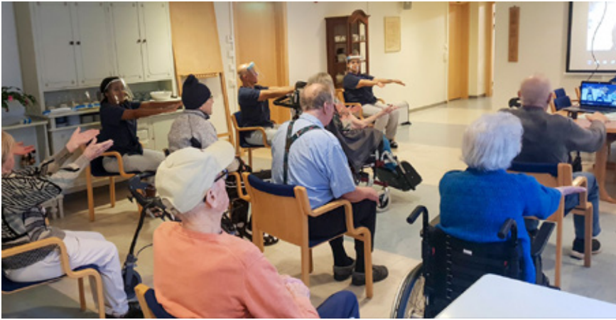
Voimistelua etäohjauksella. Gymnastik med ledare på distans.