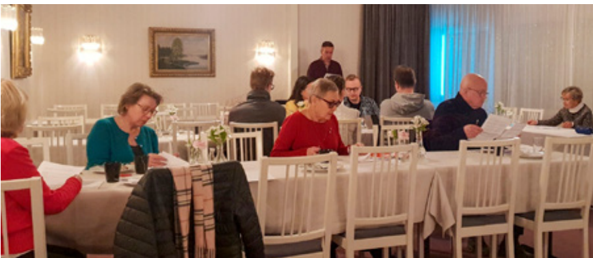
Suomikoti-ydistyksen vuosikokous marraskuussa 2020. Föreningen Suomikotis årsmöte november 2020.